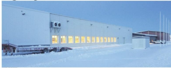
NYE JOBBER: Når produksjonen starter i fabrikk til Norwegian Fish Company i Mehamn, betyr det også flere jobber i Lakselv.