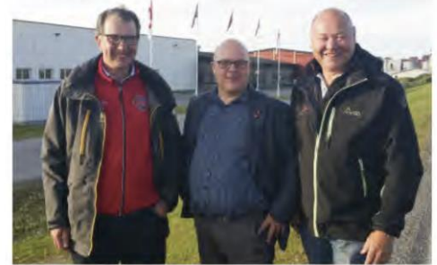
FORNYDE KARRER: (f.v.) Norwegian Fish Comp ekspress Finnmark er godt i minimalen, en stor frysete som brukes mest i forbindelse med flyfrakt av fiskepropp. Også for Norwegian Fish