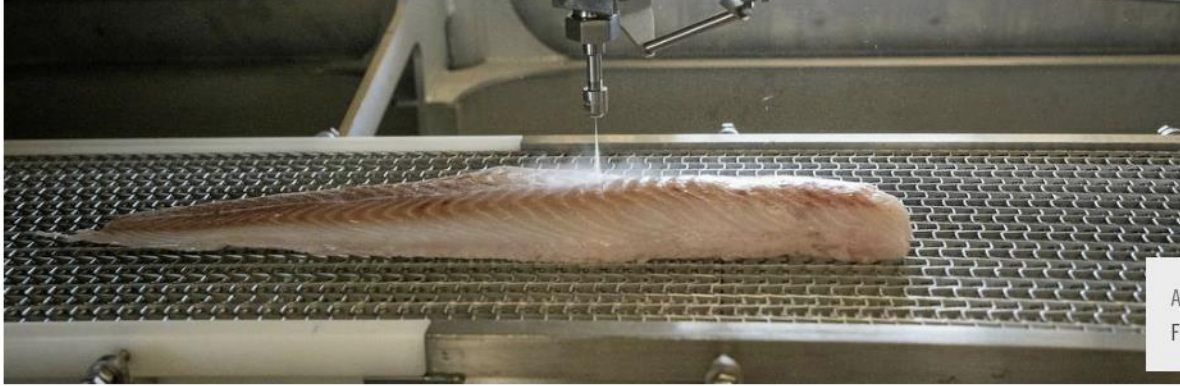
AUTOMATISERT: Automatisk filetskjærer fra Valka.