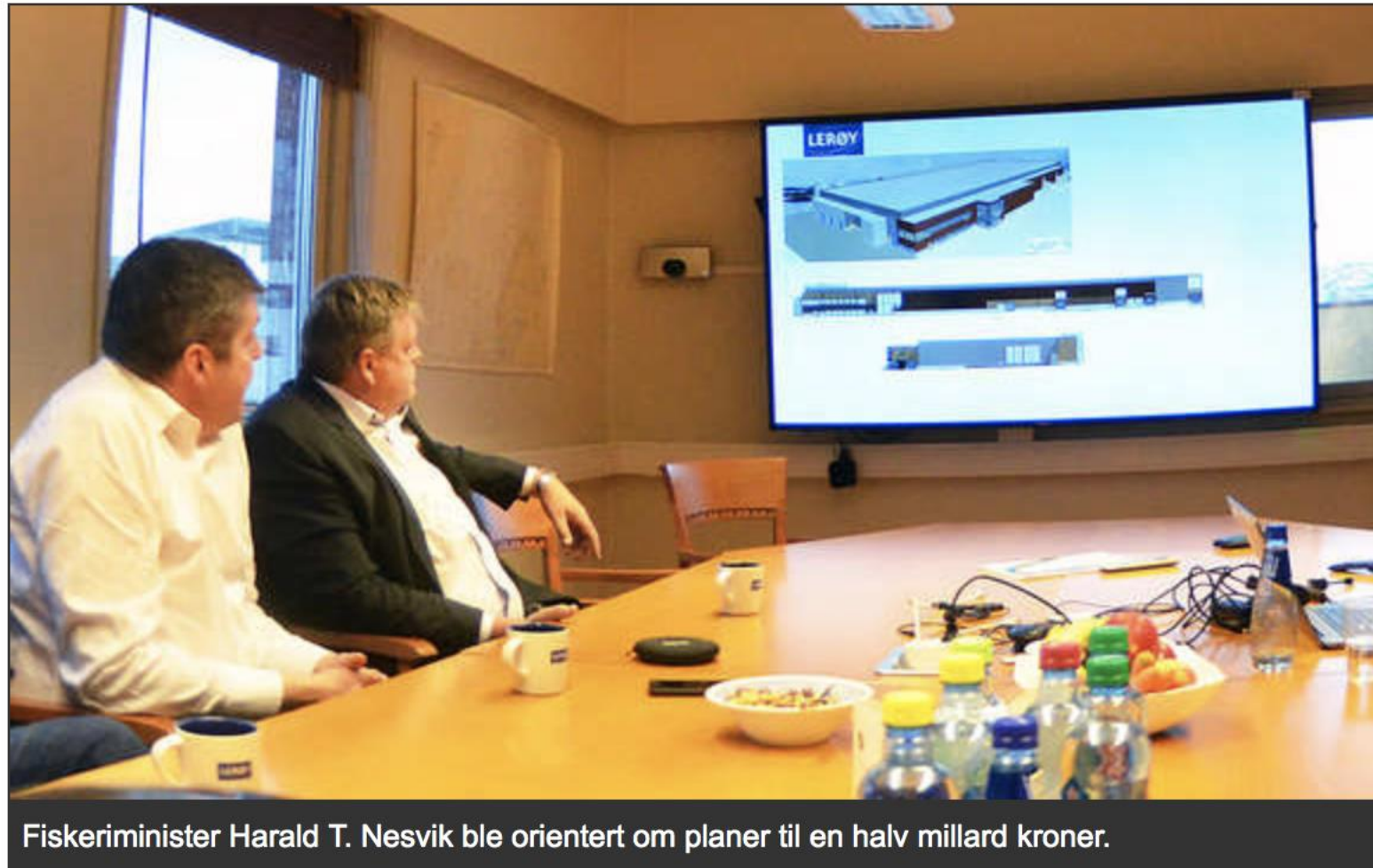
Fiskeriminister Harald T. Nesvik ble orientert om planer til en halv milliard kroner.

I Båtsfjord er Lerøy svært nær beslutningen om det skal bygges ny fabrikk.