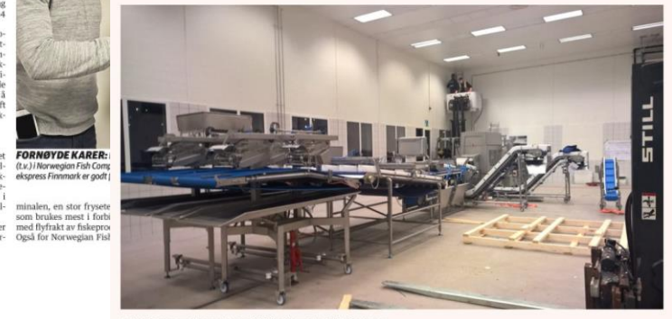
Lakselinjen er under montering.