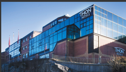
Thon Hotel Bergen Airport