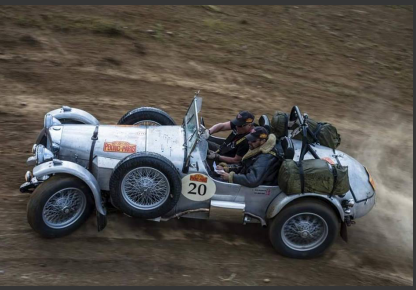
Møt denne bilentusiaststen